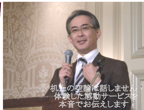
机上の空論は話しません! 体験した感動サービスを 本音でお伝えします!